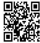
公式ホームページ

■協議会ホームページ「加須市地域雇用」で検索してください。 ( http://www.kazotksk.com/ )からも申込できます。